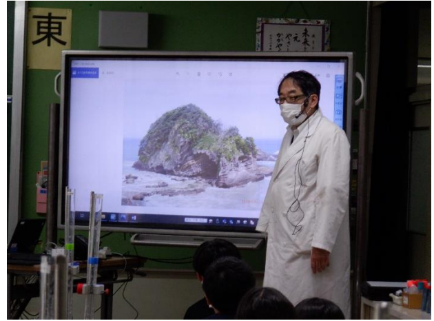
弓ヶ浜の地層が見える岩を紹介していただきました

9月17日、理科「土地のつくりと変化」の学習で、済美教育センターの先生方による出前授業が行われました。「地層は、水のはたらきによってできるのだろうか。」という学習問題を解決するために、粒の大きさの違う土を水に入れたり流したりする実験を行いました。大きな実験装置によるダイナミックな実験で、子供たちは食い入るように土が積もっていく様子を観察していました。粒の大きさによって積もる順序が違い、きれいな層になることがよく分かりました。