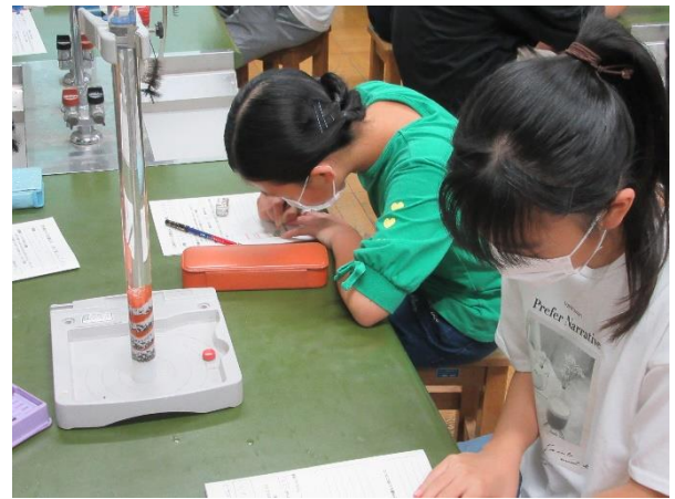
さまざまな種類の土を同時に入れると、粒の大きい土から積もっていきました