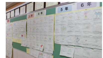
職員室前に掲示した 195点のイメージ キャラクター

「節目」という字を辞書で調べてみると、木材の節目のほかに、「物事の流れを変える、もしくは流れの変わる大きな転機」とありました。馬橋小創立70周年の節目と、杉並区教育ビジョン改定の節目が似ても重なるのもよい巡りあわせです。「竹は節ありて風雪に強し」という言葉も聞きます。節があるからこそ、竹はまっすぐ強靱に育つということです。これから迎える10年間、杉並の教育と馬橋小学校の教育活動がしなやかな強さをもったものになるように、保護者や地域の皆さまと、この節目を大切に創り上げていきたいと思ひます。ご理解とご協力を願ひいたします。