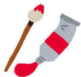
馬橋小学校 図工専科 直本 鉄平