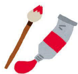
馬橋小学校 図工専科 直本 鉄平