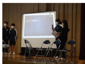
【生徒会役員によるあつた松中紹介とクイズなど】