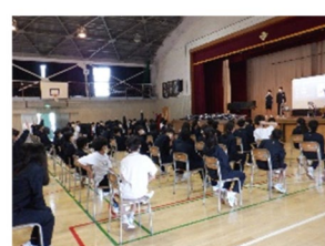
【松中クイズで盛り上がる1年生。ノリがあつた！】