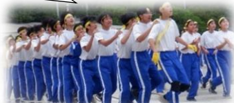
2年学年種目 チームジャンプ