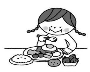
しっかり食べて栄養をとる (ビタミンCがおススメ)