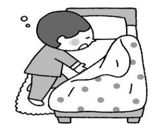
とにかく休む (あたたかくして早寝しよう)