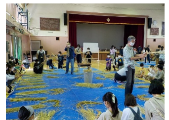
体力テスト(左)、わら馬作り(5年:右)様子

文科省及び区教育委員会からの通達に従い、感染症に気を付けながら以下の通りに行っていきます。