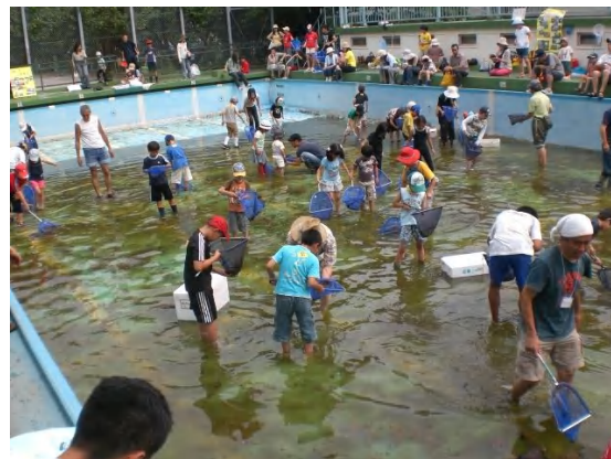
ヤゴ救出作戦の開催