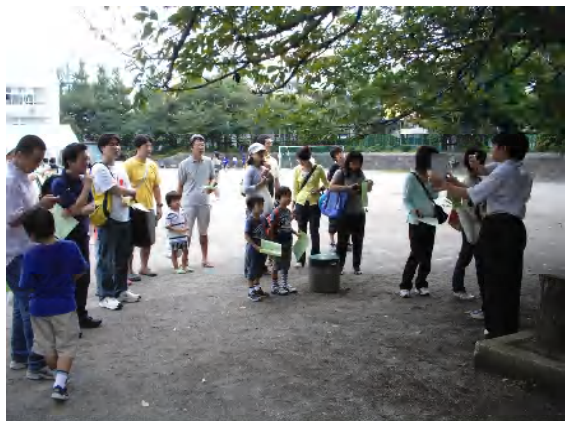
中瀬フェスタでの自然観察路中学生ガイドツアーの開催