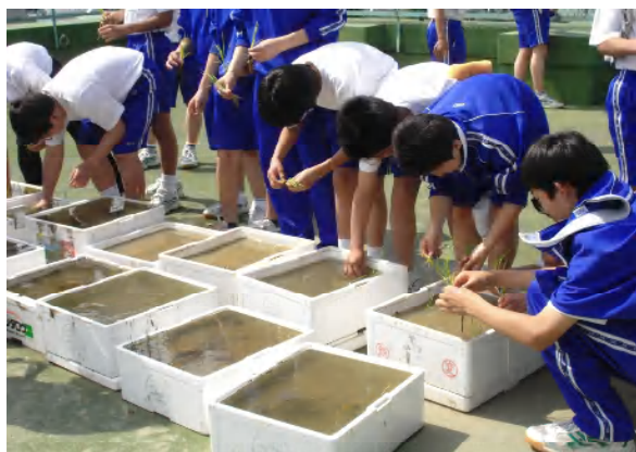
2年総合「自然耕のコメづくり」支援