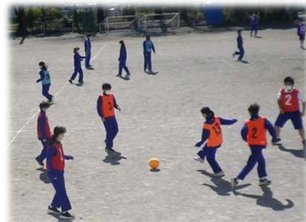
＜男女共習：サッカーの授業＞

「 体力や技能の程度、性別や障害の有無等にかかわらず 、仲間とともに学ぶ体験は、生涯にわたって豊かなスポーツライフを実現する」