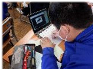
<タブレットを使ってまとめ>