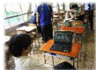
<先生も教え合いながら挑戦>

1年生は、基本は家のパソコンやスマホでチームスを試みました。チームスで昨年度に学活を行った場合、上手く繋がらなかった生徒が少なからずいました。GIGAタブレットが揃い次第、1年生に貸与します。