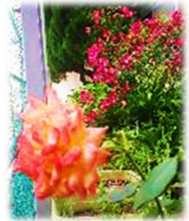
<中瀬中にもアンネのバラがあります>

中瀬中はこれまでも『 自分が感染しているかもしれないことを前提に、人にうつさないよう行動する 』ことを行ってきましたが、人と人との接触を減らし「密閉・密集・密接」をより避けるため、「 学年間15分の時差登校 」とそれに伴う「 教室配置の変更（休み時間、密にならないため） 」を以下の様に行います。（2・3年生は今年の1月にすでに行っている取組です）