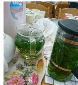
↑ お湯の中で舞う ハーブたち

透明なティーポットで淹れたので、鮮やかな緑がきれいです。温かい飲み物なのに涼しげに感じますよね。