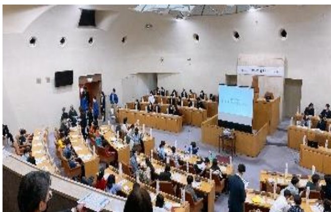
たくさんの小中学生が集まって発表しました。

時間がかかる取り組みですが、少しずつ環境が変化しています。ご来校の際は、是非ビオトープにも足を運んでみてください。