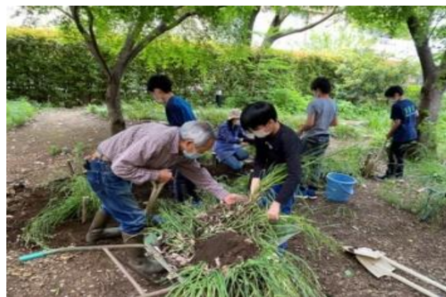
杉並区環境ネットワークの方とビオトープの整備