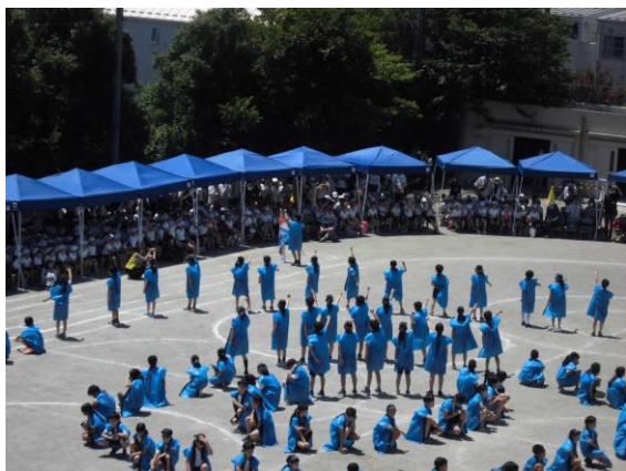
「心をついに ソーラン節」

各クラスで作った旗と一緒に、一人一人が練習の成果を出して、元気に踊ることができました。練習の途中からははぴとはちまきを渡されると休み時間の練習にも熱が入りました。本番では入場からソーラン節の決めポーズまで体全体を使って力強く踊ることができました。