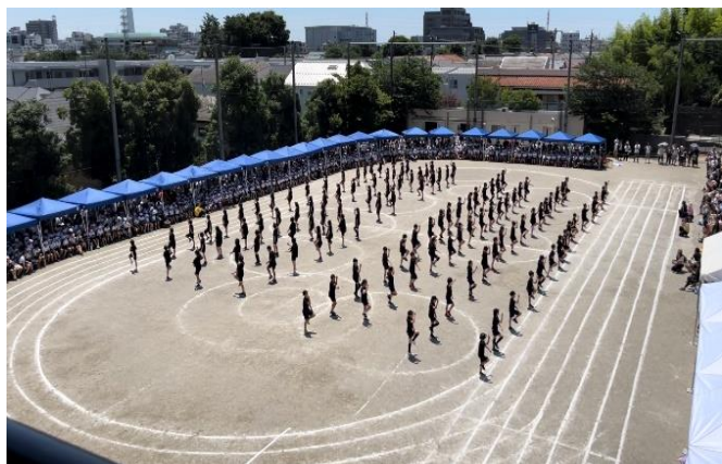
「THIS IS IT. ～Michael Jackson～」

キング・オブ・ポップと呼ばれたマイケルジャクソンのダンスに挑戦しました。実行委員を中心に振り付けを考えたりめあてを立てて練習に取り組んだりするなど、主体的に取り組み、最高学年にふさわしい演技を披露しました。