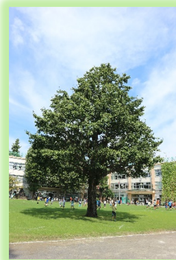
シンボルツリー・いちよう