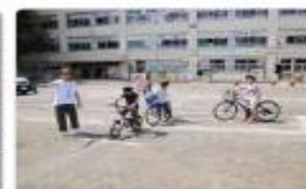
3年 自転車安全教室