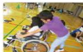
4年 車いすアイマスク体験