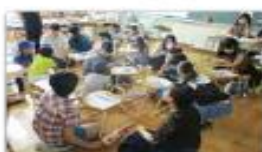
イングリッシュキャンプ