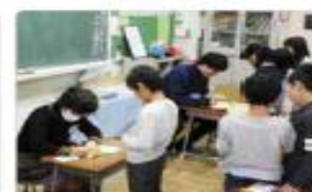
2年 かけ算九九検定