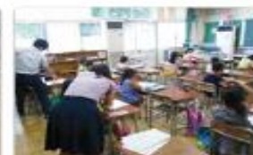
放課後学習スペース