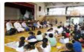
6年 プロフェッショナル