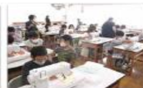
5年 家庭科授業支援