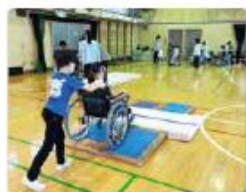
4年 車いすアイマスク体験