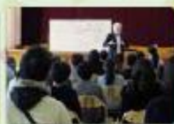
道徳授業地区公開講座