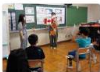
イングリッシュキャンプ