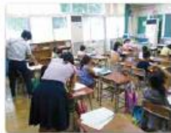
放課後学習スペース