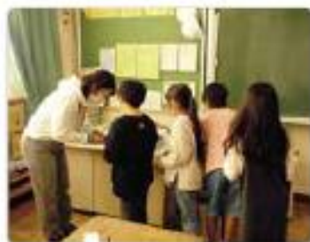
2年 かけ算九九校定