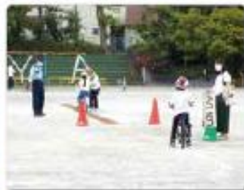
3年 自転車安全教室