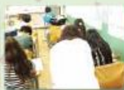
放課後学習スペース