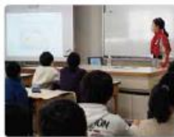
6年 プロフェッショナル