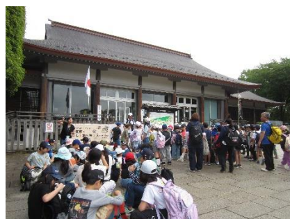
3年生遠足付き添い