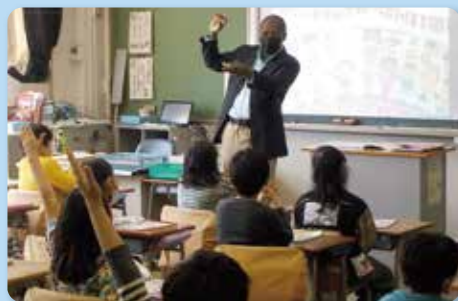
ALTによる外国語学習