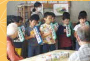
近隣高齢者施設との交流