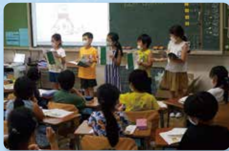
校内研究・国語科