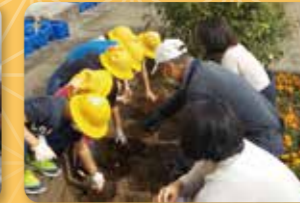
親子ガーデニング教室