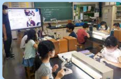
教科担任制による理科の学習