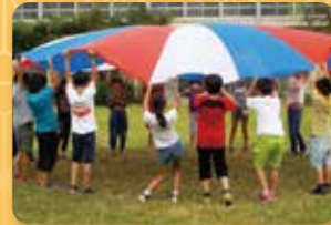
かしのみ学級、済美養護学校、自立支援施設との交流