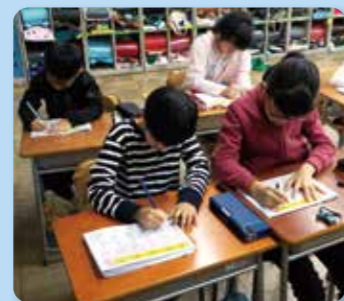
基礎基本の定着学習