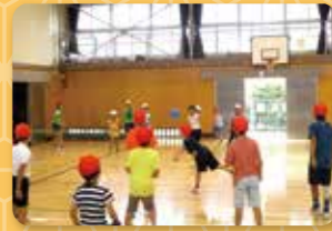
にっこり班活動(異学年交流)

異学年交流及び特別支援学級、近隣施設との交流教育を推進し、互いの人権を尊重し、共生社会の一員としての豊かな心を育みます。