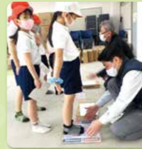
足育・上履き計測

体育科の指導や運動の日常化、足育の推進を通して、自ら健康に関心を持ち、進んで運動に取り組む児童の育成を図ります。