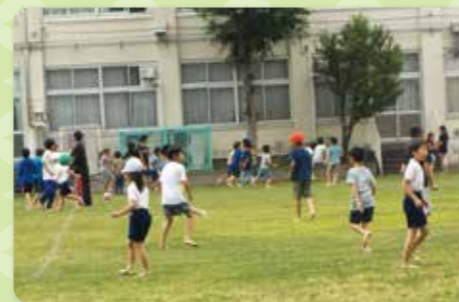
はだして遊ぼう月間