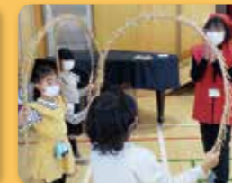
南京玉すだれ体験