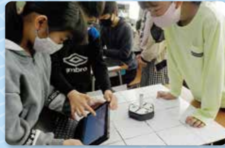
プログラミング教育