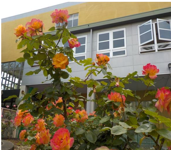
～ 中庭花壇から ～

花と緑に囲まれ落ち着いた環境の中で、生徒たちも“伸び伸びさわやか 泉南中”を、まさに体感しながら、学習や様々な活動をしています。