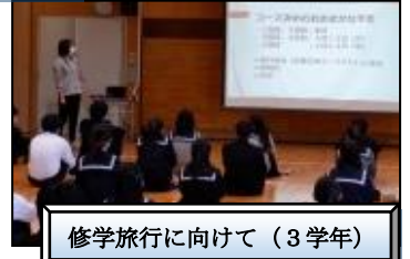
修学旅行に向けて（3学年）