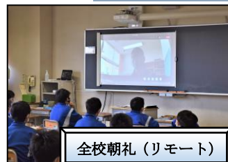
全校朝礼（リモート）