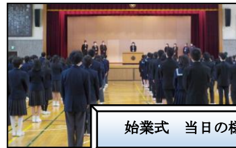
始業式 当日の様子

その後、1年生は仮入部期間を経て、4月末からそれぞれの部活動に入部し、本格的な活動が始まりました。