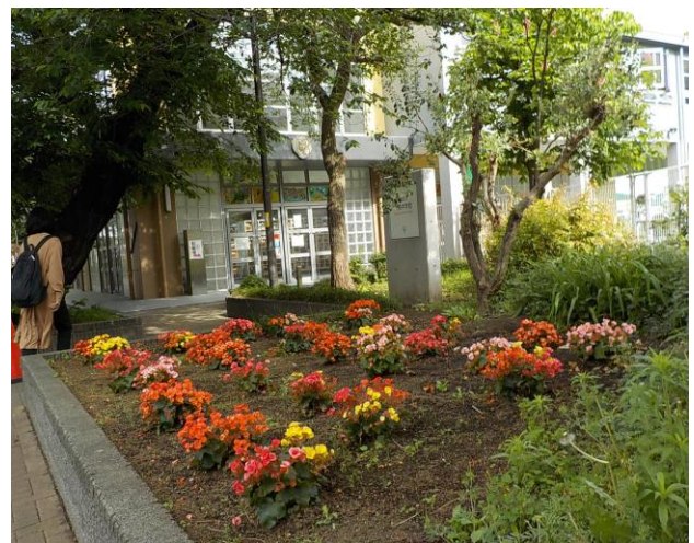
～ 正門花壇 ～