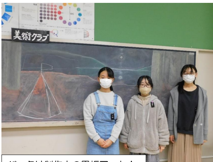
バックは制作中の黒板アート!