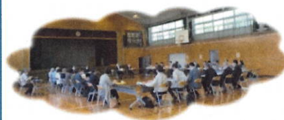
第1回校舎改築検討懇談会の様子