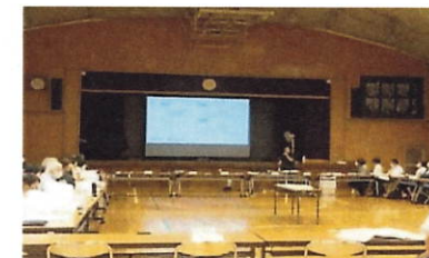
第4回校舎改築検討懇談会の様子

開催日 令和4年10月4日(火) 午後2時開始(2時間程度) 場所 天沼区民集会所 4階第3・4集会室(一体使用) (建物名:ウエルファーム杉並) (住所 杉並区天沼3丁目19番16号) 検討内容 校舎配置案検討、改築基本方針(予定) ※傍聴希望の方は、P4の担当までご連絡ください。