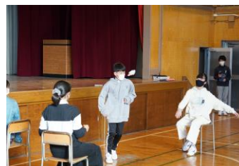
生活委員による寸劇