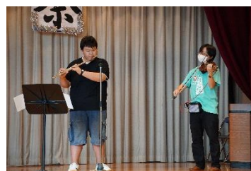
ストリート演奏部