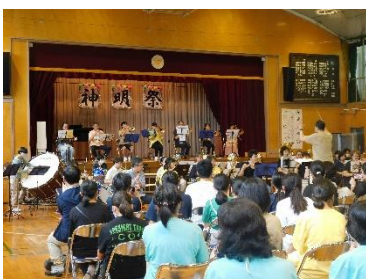
フィナーレ演奏（吹奏楽部ほか）