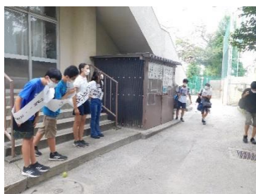
立候補者による挨拶運動