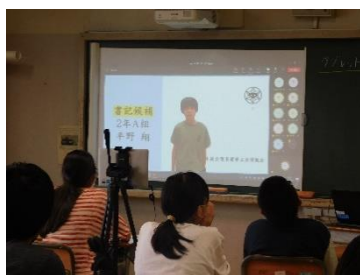
立候補者・応援者による立会演説（オンライン配信）