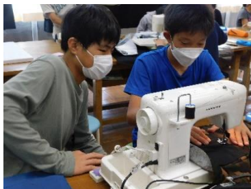
衣生活・ミシン（家庭科）