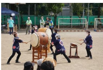
高四小和太鼓同好会