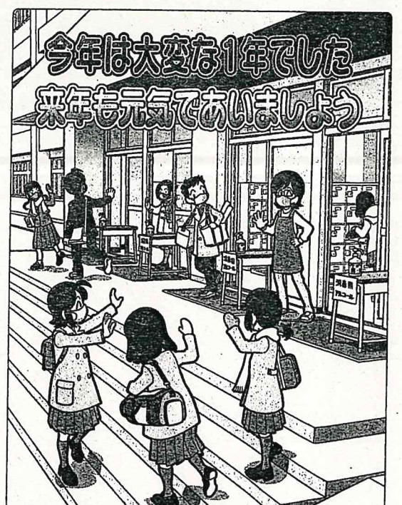
イラスト：タカハンダイスケ