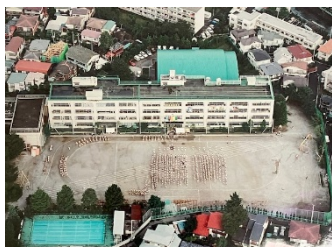
昭和 63 年度運動会

昭和 41、42 年は、5 月に校内体育記録会、昭和 43 年は校内陸上競技記録会と名称を変えて運動会は実施されました。また、校舎改築等の際には日大二高や杉並区立下高井戸運動場、武蔵野市宮競技場、都立和田堀公園のグラウンドをお借りして実施しました。そして、今年度は、台風 2 号の影響