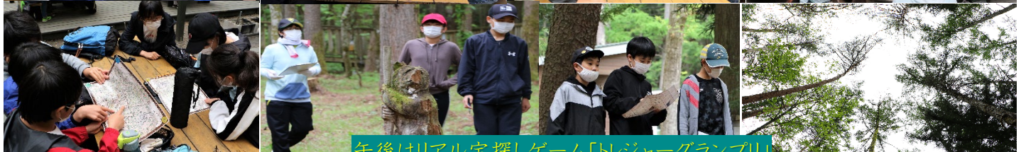
午後はリアル宝探しゲーム「トレジャーグランプリ」