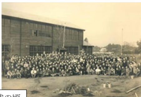
初めての校舎完成の頃

校章は、校名を松溪中学校にしたときに、ある先生が、学校の周りに多かった松の「まっぼっくり」と野の花をイメージに加えてデザインしたそうです。