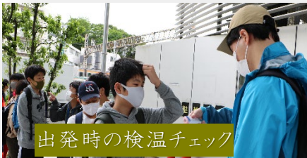
出発時の検温チェック

今回のスローガンは「みんなの良いところを見つけよう!」。入学して1ヶ月が経ち、少しずつ中学校生活にも慣れてきたところでしたが、まだ話をしたことがない人たちもいるはず。日帰りではありましたが、みんなの良いところを見つけるには十分な時間でした。この行事が1年生にとって、良いきっかけになればいいですね。