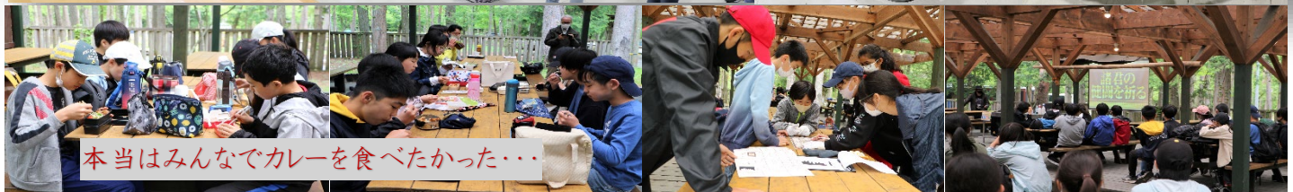
本当はみんなでカレーを食べたかった...