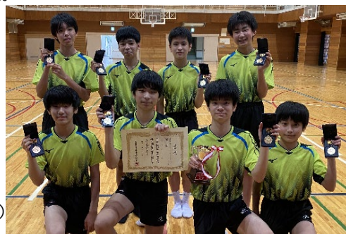
区大会優勝の卓球部男子団体。

その他、野球部、剣道部は6月に入り、公式戦が始まります。選手の皆さん、よく頑張りました。