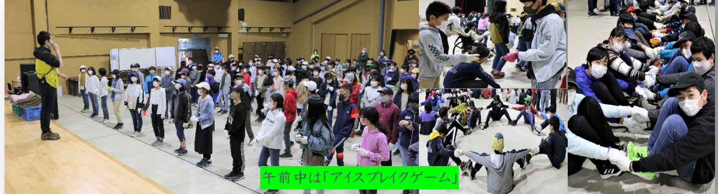
午前中はアイスブレイクゲーム