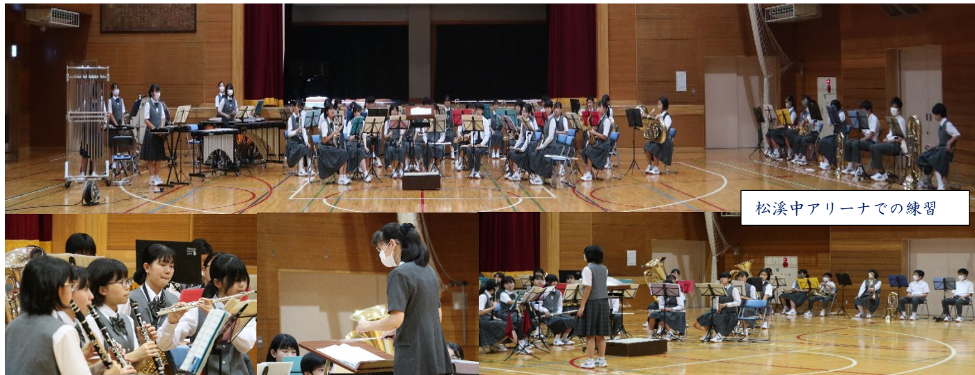
松溪中アリーナでの練習

感染予防対策として、公開されず、無観客実施は残念でしたが、最後まで美しい音色を会場内に響かせていました。よくがんばりました。おめでとうございます。