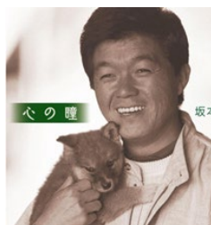
「心の瞳」は、坂本九さんの名曲です。