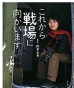
読みやすい写真絵本の形の一冊

彼女の取材の姿勢は、現地の人々に優しく寄り添うものでした。残された様々な写真から、それが感じられます。初めて本格的な取材に向かった、雲仙普賢岳の噴火による被災地で、被災者と一緒に避難所生活をしながら、同じ目線で感じ考えたこと、被災者の求めるものなどを伝えたこ