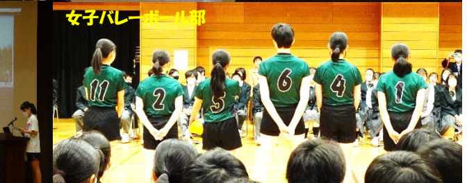
女子バレーボール部