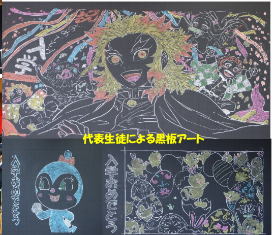
代表生徒による黒板アート