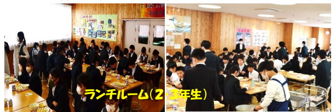
ランチルーム(2年生)

給食の形態を変えましたが、学校内での手洗い、換気等はこれまで通りに実施していきます。