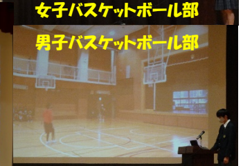
女子バスケットボール部