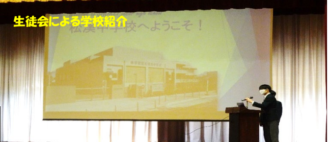
生徒会による学校紹介