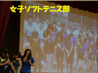
女子ソフトテニス部