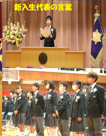
新入生代表の言葉