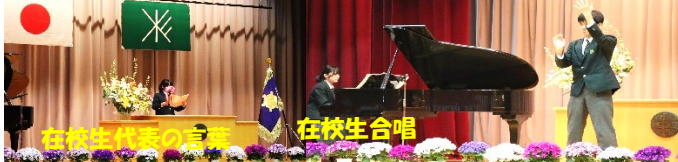
在校生代表の言葉