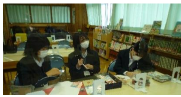
展示の相談、POP・しおりの作成