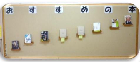
ダイナミックなおすすの本掲示