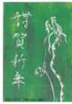
年賀状大賞コンクール 応募作品より

2024年辰年、今年もよろしくお祈りします。 『お寺のどうぶつ図鑑』（二見書房）の〈龍〉のページを調べると、妙法寺の祖師堂に彫られた龍と、高円寺の「双龍鳥居」が紹介されていて、杉並区についての新たな発見をしました。ぜひ図書館に立ち寄り、小さな発見・気づきをしてください。お正月イベントも要チェック！