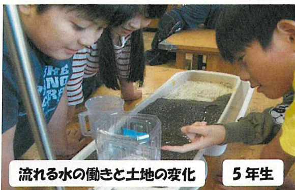
流れる水の働きと土地の変化

氷→水→水蒸気と温度によって水はその姿を変えていきます。その不思議な事象を、実験を通して調べていきました。タブレットも活用して、水の変化の様子を捉えました。