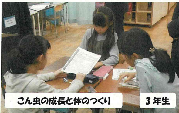
こん虫の成長と体のつくり

1学期から大事に育ててきたサツマイモやサトイモの観察を行いました。12月には児童が考えたサトイモ料理が給食のメニューにも出てくる予定です。今からとても楽しみです。