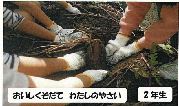
おいしくそだて わたしのやさい

蚕糸の森公園で拾った秋の葉や実を使って、おもちゃづくりを行いました。うまくいかないところは、友達と相談しながら作りました。みんなで遊び合うのも楽しみです。