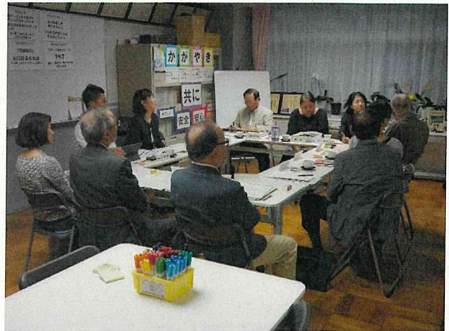
▲10月4日 中秋の名月の日に

これまでも「学校評議員会」があり、貴重なご意見をいただいていたいました。学校運営協議会では学校の提案を承認していただいたり、共に話し合ったりしながら、もっと「地域と共にある学校」として、杉十の子供たちのさらなる「かがやき」のために目標を共有し、課題を話し合い、皆様にも発信していきます。どうぞよろしくお願いいたします。