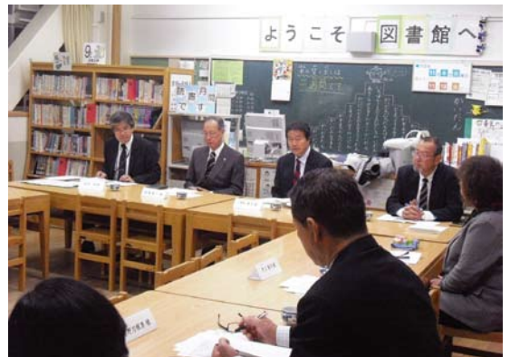
運営協議会は図書室で行われます