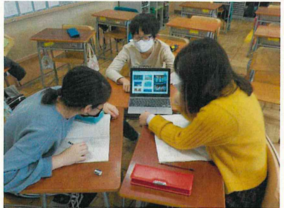
昔遊びチーム 「楽しい 多種多様 昔遊び」