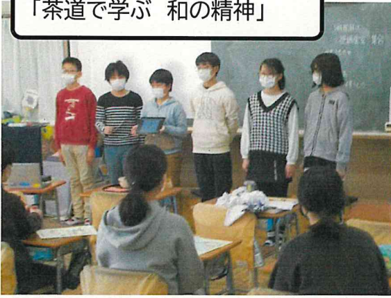
茶道チーム 「茶道で学ぶ 和の精神」