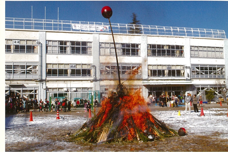
杉八小校庭にて恒例のどんど焼き 平成 25 年 1 月 19 日（土）

http://www.suginami-school.ed.jp/sugi8shou