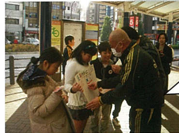
高円寺駅前でアンケート