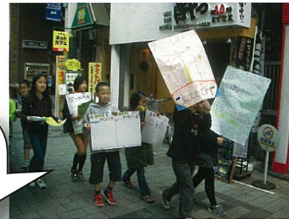
パル商店会で宣伝活動