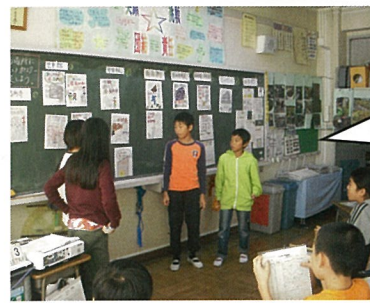
クラスみんなで宣伝会議