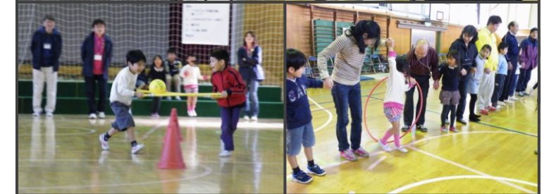
第6回我が街ふるさと運動会

昨年11月24日に10の町会の方々にご協力いただき、杉八小体育館で『我が街ふるさと運動会』を行いました。