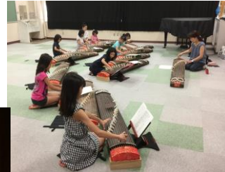
▲箏クラブ練習風景 ◀ 杉並三曲協会 定期演奏会