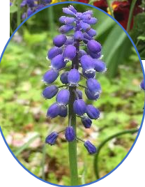
ムスカリの花って ブドウに似ているね