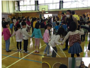
▲▶ 杉三小と 合同で実施く1 年生と遊ぼう

今までに親&児の会が担当したサタハチは半分くらいでしょうか。思えばサタハチではいろんな企画（思いつき）を実現させてもらいました。例えば数年前までやっていたザリガニ釣りもそうです。当時の6年生全員が蚕糸の森でザリガニ釣りをして一匹もつれなかったと