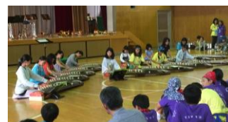
▲こうえんじこどもまつり