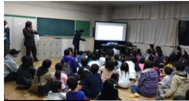
▲月を観る前に宇宙についてのはなしを聞きました