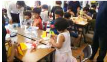
▲ペットボトルロケット大会 令和元年 7 月 6 日