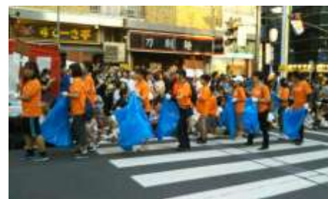
▲5,6年生「自分たちの高円寺阿波おどり」 便乗ゴミの問題や高円寺の美化を呼びかける啓蒙活動をおこないました。当日は連と連の間でゴミを回収と分別して歩きました。

担任の先生は子どもたちが、創造し、考え、学ぶことの楽しさを与えるきっかけを作るような授業を考えてくださいましたが、限られた先生の人数や他地域から移動して来たばかりの先生にとって、地域が分からないなど苦労をされていたようです。そこで、コーディネーターが学びの幅や可能性を大きく広げるために、ゲストティーチャーや職場体験の受け入れ場所、外部団