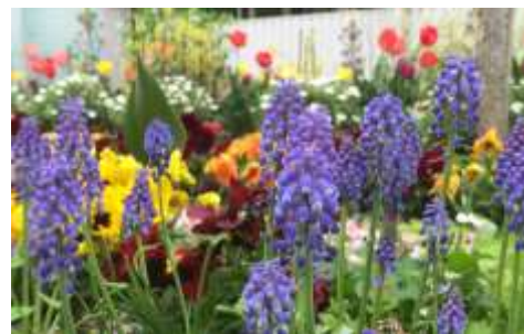
▲毎年、春にはお花畑になります