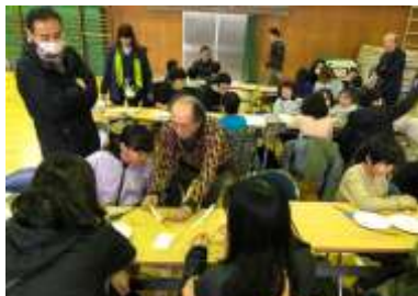
▲理科実験ゴムドローン 令和元年 12 月 7 日