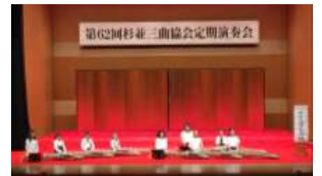
▲杉並三曲協会定期演奏会 2019 年 5 月 19 日

を寄贈してくださった方もいらっしゃいました。ありがとうございました。杉八小箏クラブはなくなっていますが、また和楽器にふれる機会があればいいと思います。