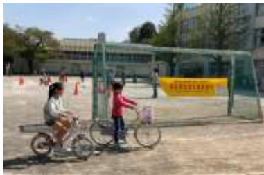
▲自転車安全教室 平成 31 年 4 月 20 日