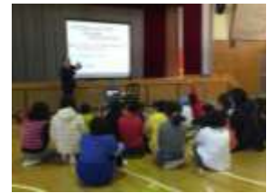
▲たまご落とし 令和元年 2 月 1 日