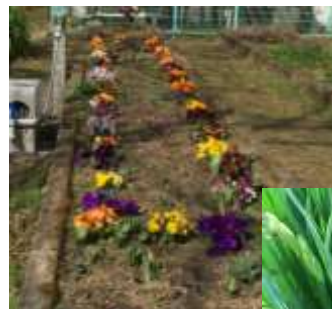
▲色鮮やかなパンジー

今年2月末の花壇ではパンジーが色鮮やかに咲いていました。チューリップはこれからぐんぐん伸びていきそうです。スイセンは数個咲いていましたが、つぼみがまだまだたくさんありました。子どもたちが野菜を育てていた学級の菜園は枯れた草でおおわれてしまっていたのですが、その中にひょっこりとクロッカスが咲いていました。今年の春も杉八には様々な花たちが咲くことでしょう。