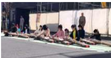
▲高円寺フェス 2019 年 10 月 26 日

土曜日学校が始まった 2002 年から活動を続けてきたのが〈箏クラブ〉です。最初の頃はあまり人数が多くなかったけれど、箏を弾いてみたい子どもが一人でもいたら教えていただけました。毎年こうえんじこどもまつりの青空ステージで演奏していましたが、2007 年に初めて杉並三曲協会定期演奏会に参加させていただき、大人の方々と一緒に舞台上で演奏させていただきました。以来、毎年参加させていただきました。他にも高円寺フェスなどの地域のイベントにも参加するようになり、練習も一層熱心に取り組むようになりました。これは地域の方々のご協力があったことだと思います。箏