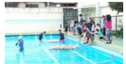
▲ヤゴいかだを作ろう 令和元年 9 月 14 日