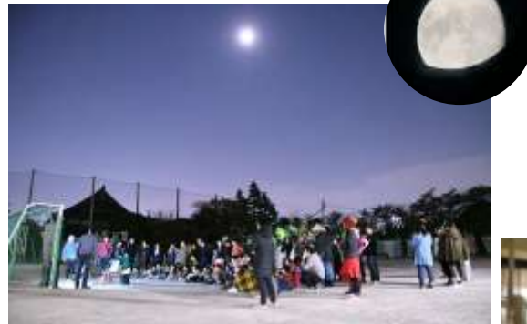
▲月を観よう 令和元年 11 月 9 日