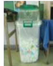
▲エコキャップ分別作業 令和元年7月22日