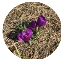
▲ひょっこり咲いていたクロッカスを見つけました