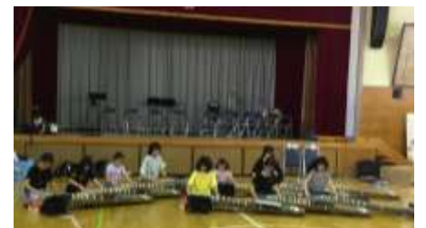
▲こうえんじこどもまつり 2019 年 10 月 13 日