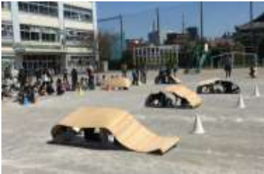
▲新一年生と遊ぼう！ 平成 31 年 4 月 13 日