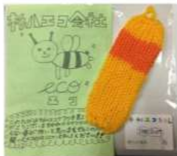
▲4年生「こちらエコライフ研究所」 エコたわしの販売をしました。 2020年1月21日パル商店街