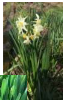
◀これからもっと咲きます