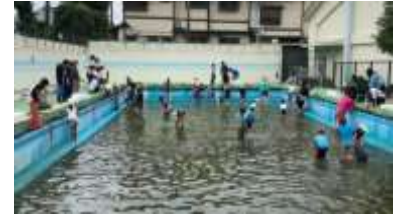
▲ヤゴ救出大作戦 令和元年 6 月 2 日