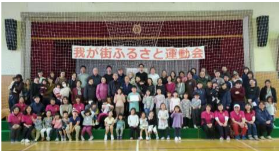
▲今回で最後になるということで、閉会後にみんなで写真を撮影しました 令和元年 11月24日

地域と杉八の子どもたちと一緒に何かできないかと始めたのが「我が街ふるさと運動会」です。今年度で12回目を数えました。