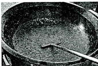
スパゲティーのミートソース

これらの事は、料理が温かいという事だけでなく、安全衛生に気をつける上でとても大切です。給食室では今日も、子どもたちが笑顔になるのを楽しみにしながら、温かくておいしくて安全な給食づくりに取り組んでいます。