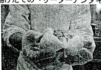
肉まんの中はホッカホッカ