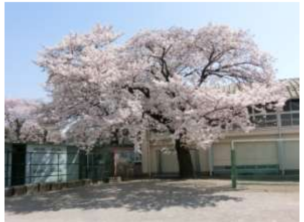
▲東京の桜前線の満開の日の校庭の桜

学校においては、目に見える形で教育を行っています。もちろん、ご家庭においても、また地域においても同様であると思います。それぞれには、その環境や文化、歴史などによって培われた風土があります。この風土というものが「見えへん力」となって子供たちに働きかけ、杉八小を支える大きな力となっていると私は考えています。幸いにして、本校の保護者や地域の方々は、子供たちを慈しみ大切に育てようとする思いを強くもっています。今年度においても、宝物である子供たちをきめ細かく育ててまいります。ご支援ご協力をいただきながら歩調を合わせ、「見える力」と「見えない力」をバランスよく発揮し、教育に取り組んでいきたいと考えています。どうぞよろしくお願いいたします。