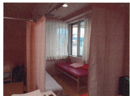
↑ 見守りコーナー (保健室奥)