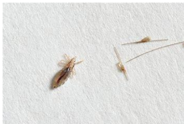
見つけやすい場所

■成虫の特徴・大きさは2～4mm・体の色は褐色から灰白色、吸血後赤く見えますが次第に黒っぽくなってきます。・寿命は約1ヶ月・雌雄ともに頭皮から吸血します。・卵を一生の間に約100個、1日約5～6個、頭髮の根元近くに産み付けます。・光を嫌い、髪の毛の中に隠れています。・人から離れると約7時間～3日間で死ぬといわれています。