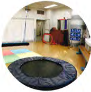
体の動かし方を学んだり、友だちと遊んだりするプレイルーム。(杉並第十小学校)