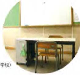
学習室 (高井戸小学校)