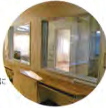
マジックミラーを隔てて見学できるようになっています。(高井戸第四小学校)