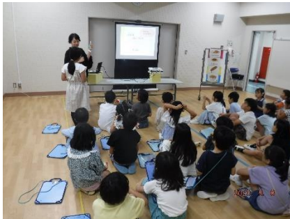
みんなの考えを知る活動 ～好きなもの・苦手なものはなあに～

今回の授業のねらいは、「誰にでも得意なことと苦手なことがあり、苦手なことがあっても得意なことや好きなことを生かして、頑張ろうとする気持ちが大切であることに気付くことができる」です。授業の中では、子供たちからたくさんの感想が出て、どれも素敵なものでした。活動の様子と合わせて、紹介させていただきます。