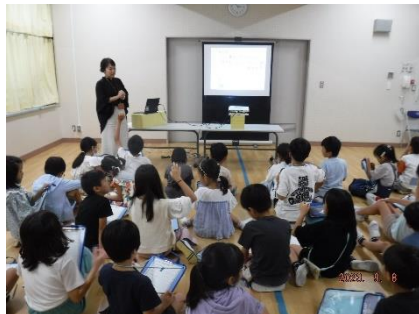
自分の得意なこと・苦手なこと について考えました