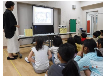
苦手なことがあっても好きなことを 活かして頑張った人について知る活動