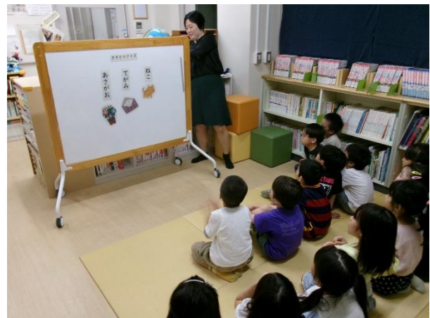
ききとり クイズ (音の順序に気付き、言葉を考える活動)