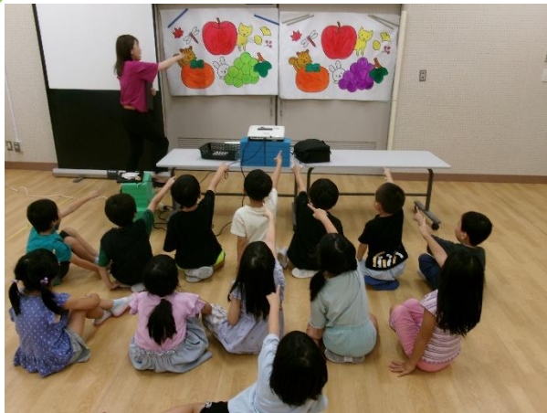
よく聞いて、みつけよう！ (お話を聞いて内容に合う絵を探す活動)

9月4日(木)に、校内の1年生に向けて共生社会教育授業「『ことばの教室』について知ろう～どんなところかな」を実施しました。ことばの教室では、共生社会「誰もが相互に人格と個性を尊重し支え合い、人々の多様な在り方を相互に認め合える全員参加型の社会」を作っていく子供たちに向け、「共生社会教育」という名称で、校内の1、3、5年生を対象に授業を行っています。今回の1年生の授業のねらいは、「『ことばの教室』の役割を知る」です。クラス毎に授業を行い、ことばの教室についての紹介、学習室やプレイルームなどの見学、ことばの教室で行う学習の体験などをしました。1年生の皆さんが興味をもちながら取り組みました。