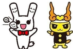
ことはちゃん ガンバくん (ことばの教室のキャラクター)