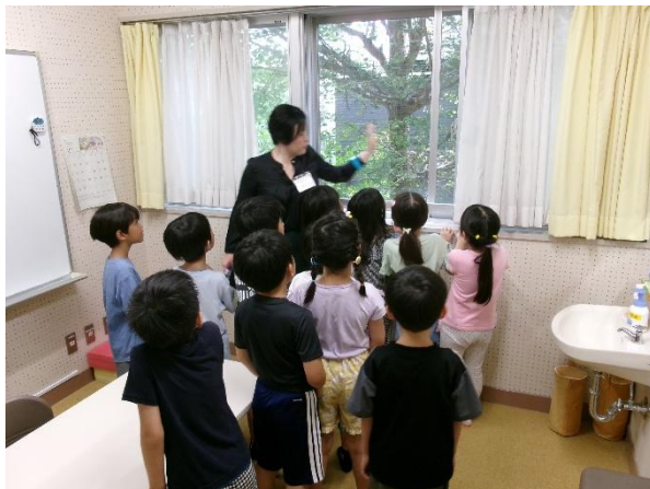
ことばの教室の見学