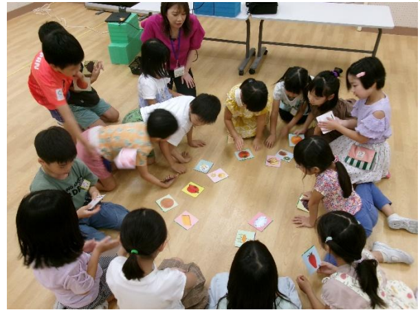
なかまをさがそう！ (絵カードを見て、テーマに合うなかまをさがす活動)